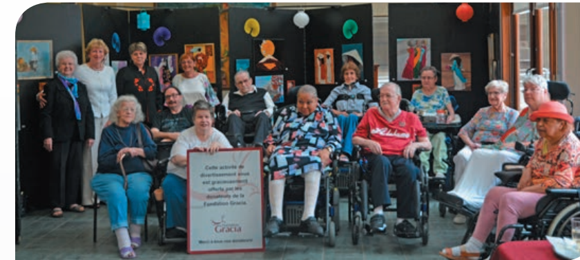
◀ Les résidents artistes-peintres du Centre d'hébergement Notre-Dame-de-la-Merci.